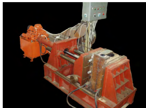
Slika 2. Horizontalna livačka mašina

Obzirom da se radilo o potpuno novom postupku tokom livenja kontrolisani su svi parametri relevantni za kvalitet odlivaka: