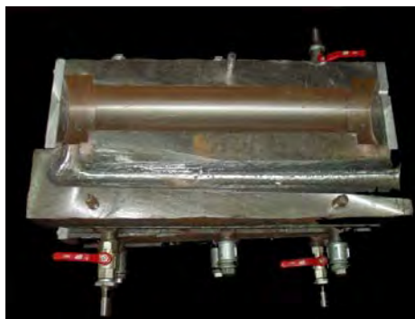
Slika 1. Izgleda livačkog alata

Predviđena je konstrukcija rasklopive kokile sa automatizacijom i regulacijom otvaranja i zatvaranja kokile. To je omogućilo jednostavno rukovanje sa kokilom, brzo i lako odstranjivanje odlivaka iz kokile. Pri konstrukciji uzeto je u obzir da kokila pri radu trpi velika unutrašnja naprezanja. Predviđeno je premazivanje kokila u cilju zaštite, obezbeđenja dobrog odvajanja odlivaka od zida kokile, dobrog odvoda gasova i postizanja višeg kvaliteta površine odlivaka. Na sl.1-2 prikazan je izgled livačkog alata i horizontalne livačke mašine primenjenih za izvođenje eksperimenta.