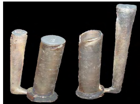
Slika 4. Izgled dobijenih odlivaka

Važan faktor kvaliteta odlivaka je temperatura livenja. Povišena temperatura livenja preporučuje se za odlivke sa tankim zidovima, za legure sa smanjenom tečljivošću i u nekim slučajevima za eutektičke legure pri dobijanju detalja sa različitim debljinama zidova. Smanjena temperatura livenja povećava sklonost ka pojavi unutrašnjih grešaka u odlivku, kao i pukotina u odlivcima sa velikom razlikom u debljini zidova, naročito u odlivcima od eutektičkih legura. Optimalna temperatura livenja određena je u zavisnosti od hemijskog sastava legure, konstrukcije kokile, temperature kokile, ulivnog sistema, brzine livenja. Visoka temperatura livenja, kao i visoka temperatura kokile nepovoljno utiče na mehanička svojstva odlivaka. Neophodno je stoga, za svaki konkretan slučaj – vrstu legure i vrstu kokile, iznaći najpovoljniji odnos.